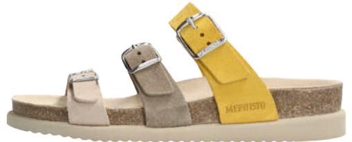
Hyacinta • 35 - 42