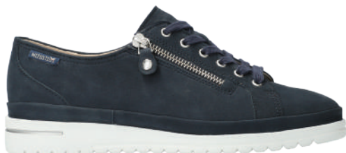
June ° 3 - 8