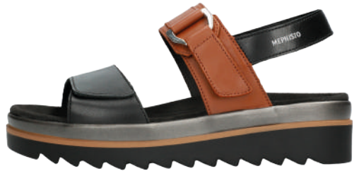
Dakota ° 35 - 42