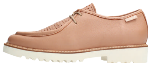
Sonie Perf • 2½ - 8½