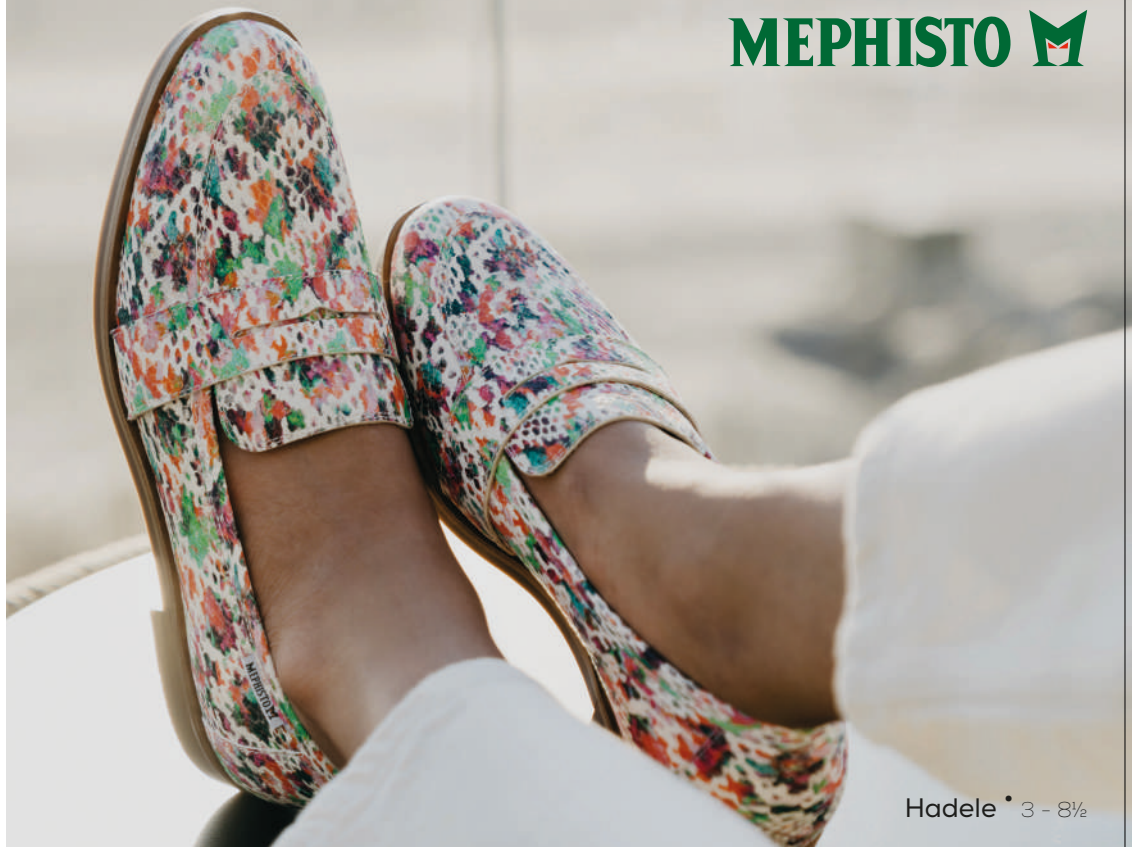
Hadele • 3 - 8½