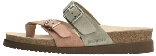
Happy • 35 - 42