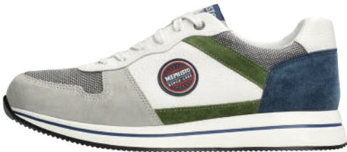
Garry Air ■ 6 - 12½