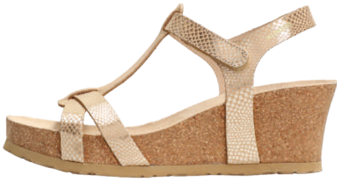
Liviane • 35 - 42