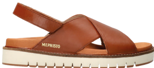
Blanche ° 35 - 42