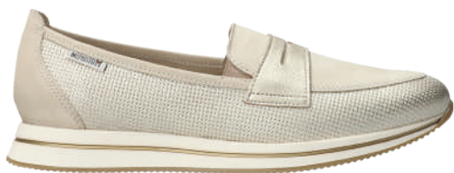
Lya ° 3 - 8½