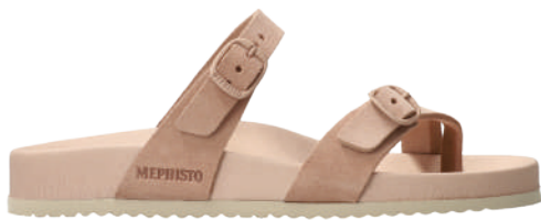
Kristal ° 35 - 42

Une collection intemporelle pour vous accompagner tout l'été.