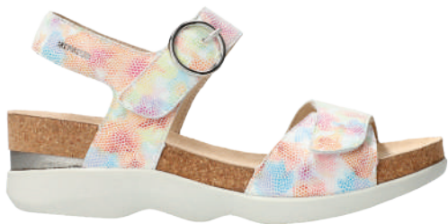
Oriana • 35 - 42