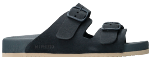
Kora ° 35 - 42