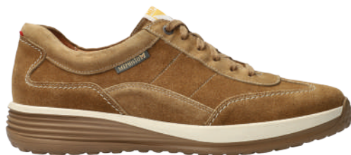
Steve ° 6 - 12½