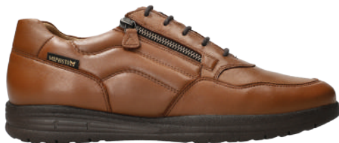
Ilkar ° 6 - 12½