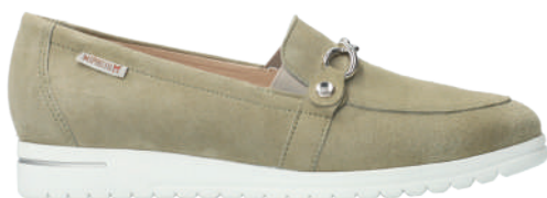
Juliana ° 3 - 8