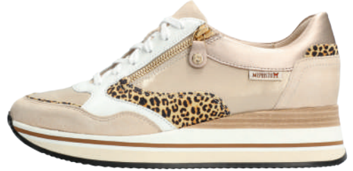
Olimpia ° 3 - 8½