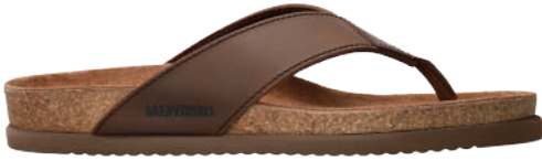
Natalio • 39 - 48