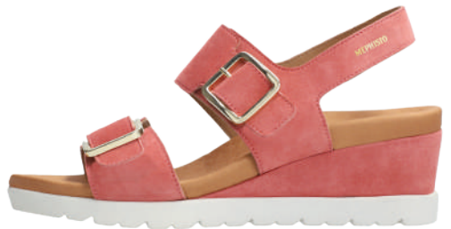
Ysabel ° 35 - 42