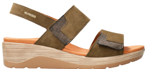
Calie ° 35 - 42