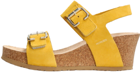
Lissandra • 35 - 42