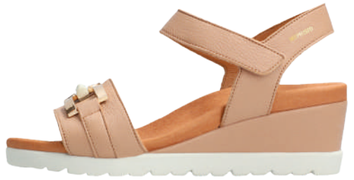
Yulia ° 35 - 42