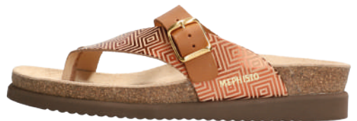
Helen Mix • 35 - 43