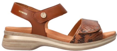
Florentina ° 35 - 42