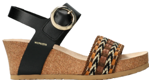
Laure • 35 - 42

Couverture : Tiany • 35 - 42 | Titouan • 6 - 12½