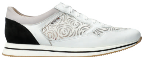
Laponia ■ 3 - 8½