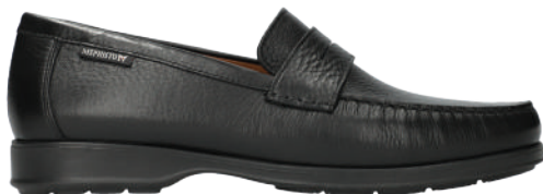
Harper • 6 - 12½