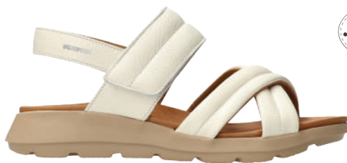
Tiany ° 35 - 42