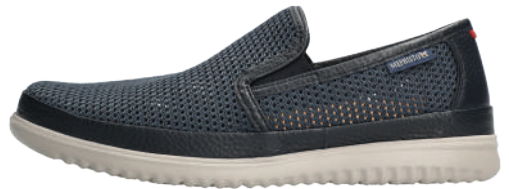
Terry ■ 5½ - 12½