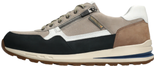
Bradley ° 5½ - 12½