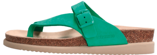
Helen • 35 - 43