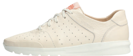
Marilis ° 3 - 8½