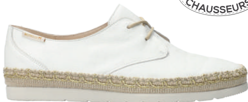
Voleta ■ 3 - 8½