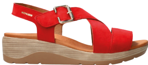
Claudine ° 35 - 42

Une collection intemporelle pour vous accompagner tout l'été.