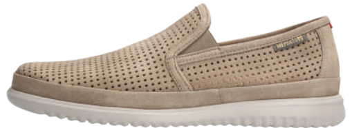
Tiago • 5½ - 12½