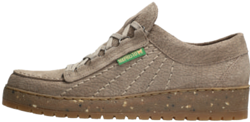
Rainbow ° 5 - 12½