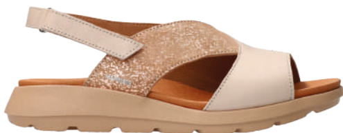
Tomazia ° 35 - 42