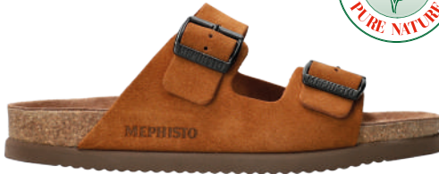
Nerio • 39 - 48