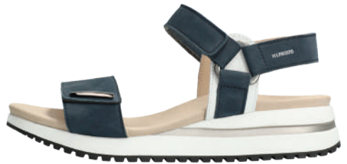
Jeanie ° 35 - 42