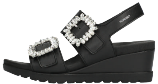
Ysabel Spark ° 35 - 42