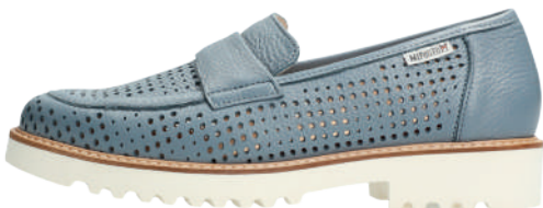
Stessy Perf • 2½ - 8½