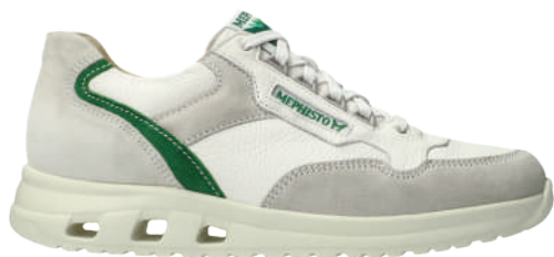
Jansen ° 6 - 12½