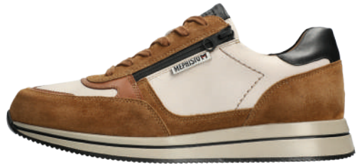
Gilford ° 6 - 12½