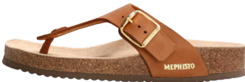
Melinda • 35 - 42