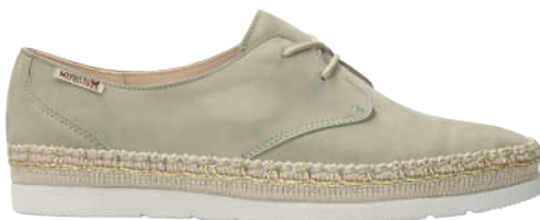
Voleta ■ 3 - 8½