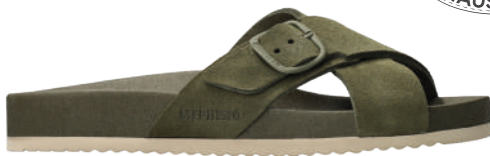
Kennie ° 35 - 42