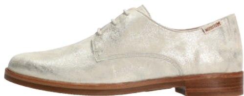
Helsa • 3 - 8½