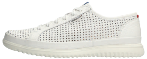
Tom Perf° 5½ - 12½