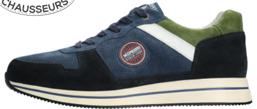
Garry ° 6 - 12½