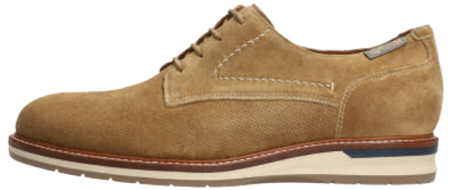
Falco Perf° 6 - 12½