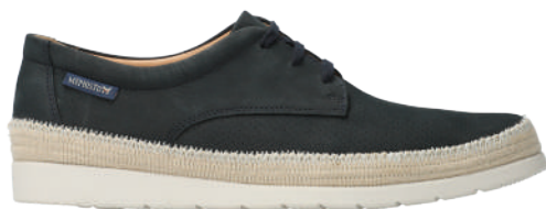
Varney Perf ■ 6 - 12