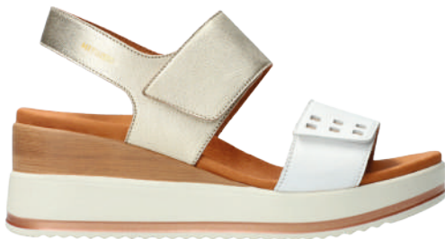
Swena N ° 35 - 42