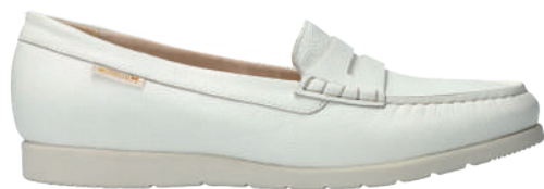
Volga • 3½ - 8½