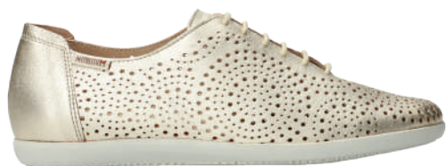
Katie Sun • 2½ - 8½