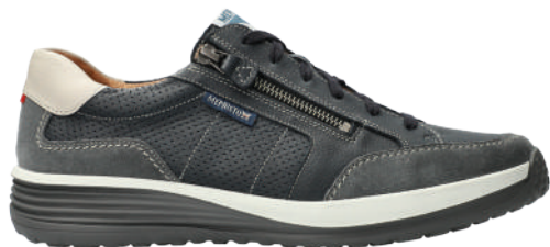
Sacco ° 6 - 12½