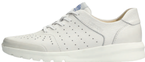
Waren ° 6 - 12½