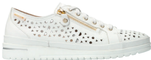
June Perf ° 3 - 8