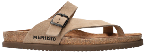
Niels • 39 - 48