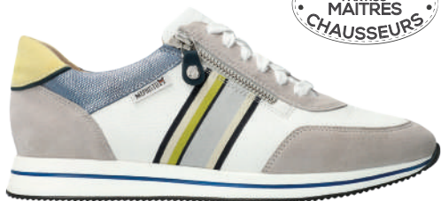
Lucille ° 3 - 8½