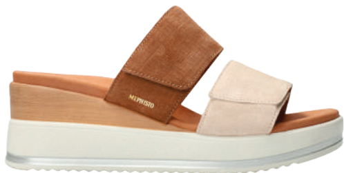
Sophya ° 35 - 42