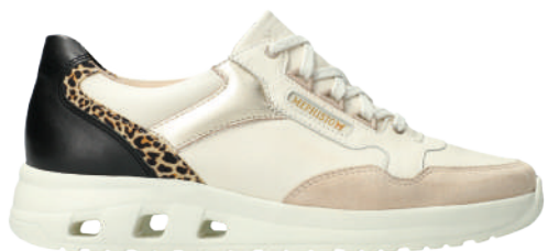
Lorane ° 3 - 8½