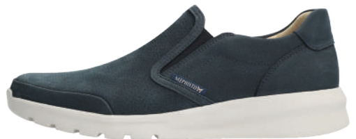
Will Perf ° 6 - 12½