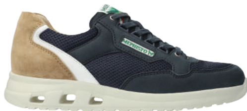
Jansen Air ° 6 - 12½