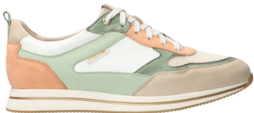
Lydie Air * 3 - 8½