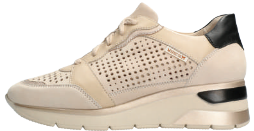
Eline Perf ° 3 - 8½