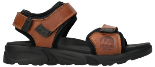
Tito ★ 39 - 48