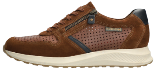
Dino Perf ° 6 - 12½