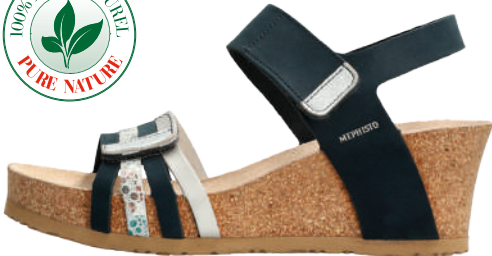
Lucia • 35 - 42