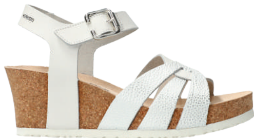
Lesley • 35 - 42