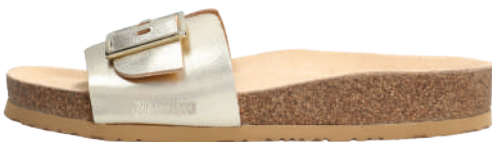
Mabel • 35 - 42