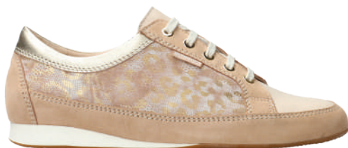
Bretta ° 2½ - 8½