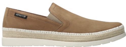
Volker ■ 6 - 12