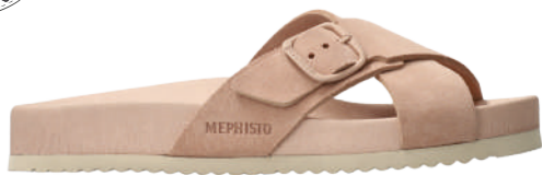
Kennie ° 35 - 42