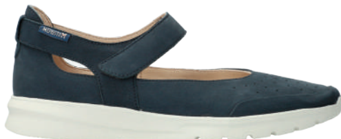
Marsia • 3 - 8½

Cuirs lisses, unis ou imprimés , nos chaussures offrent une variété de styles, s'adaptant parfaitement à toutes vos préférences.