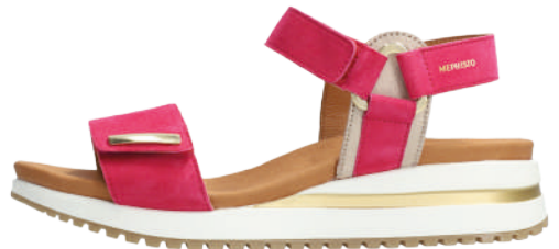
Jeanie ° 35 - 42