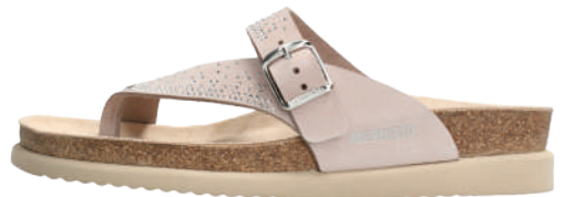
Helena Spark • 35 - 43