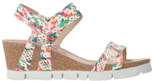
Emelia • 35 - 42