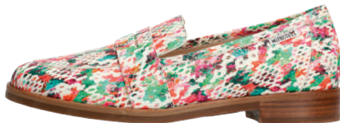
Hadele • 3 - 8½