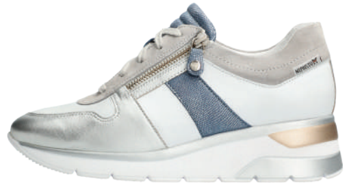
Elisia ° 3 - 8½