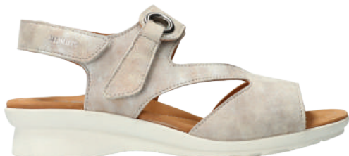
Prissie ° 35 - 42

La technologie SOFT-AIR est le secret de l'extraordinaire confort de marche de toutes les sandales et chaussures Mephisto.