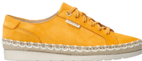
Valenta ■ 3 - 8½