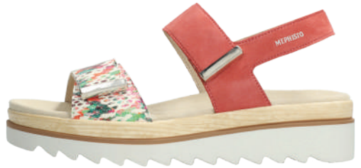
Dominica ° 35 - 42