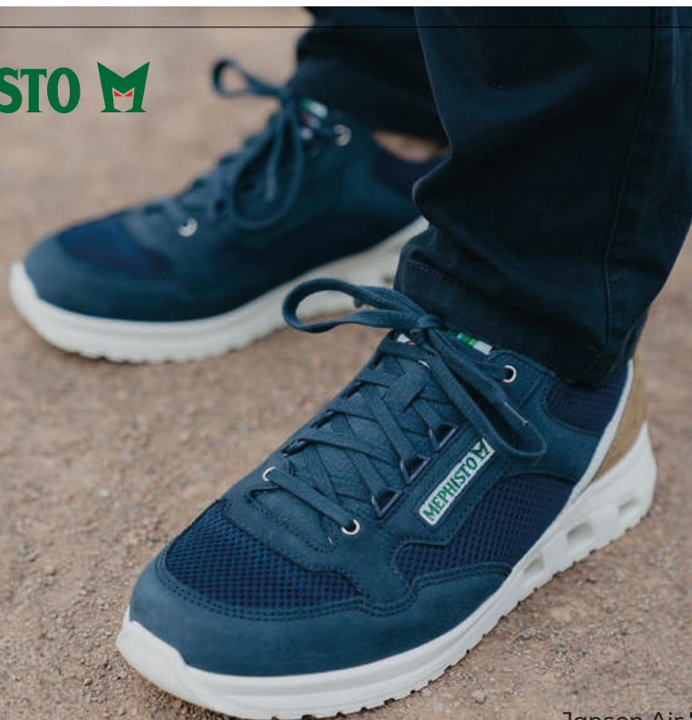
Jansen Air ° 6 - 12½