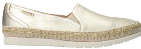
Valina ■ 3 - 8½