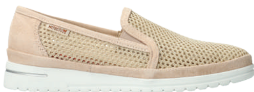
Jana Air ■ 3 - 8