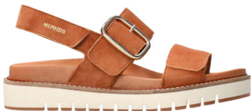
Belona ° 35 - 42