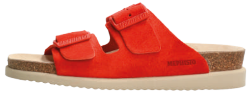
Hester • 35 - 42